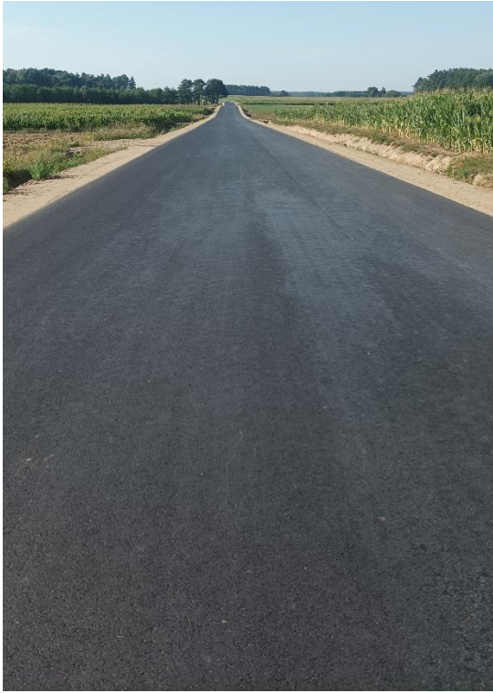
Fot. 7 DP 1882B Żebry-Okurowo-Brzózki