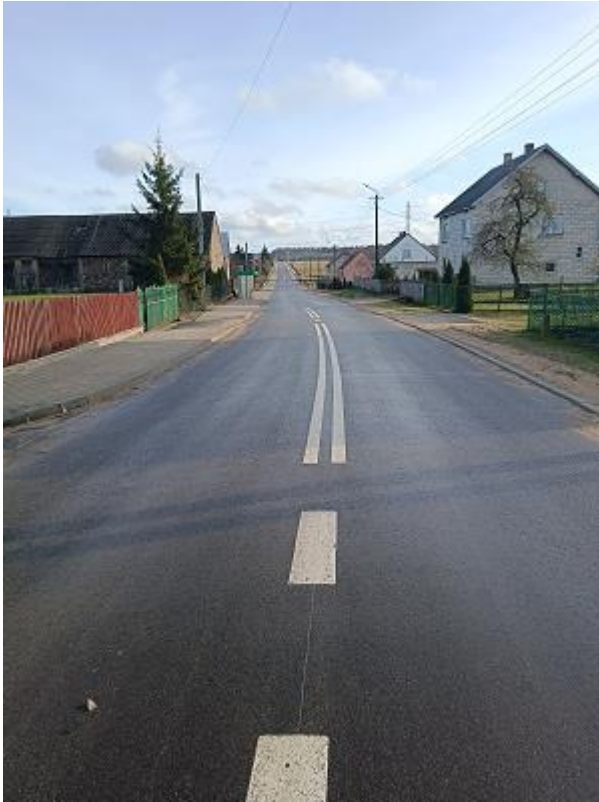
Fot. 11 DP 1830B Stawiski -Jurzec Wł. etap II