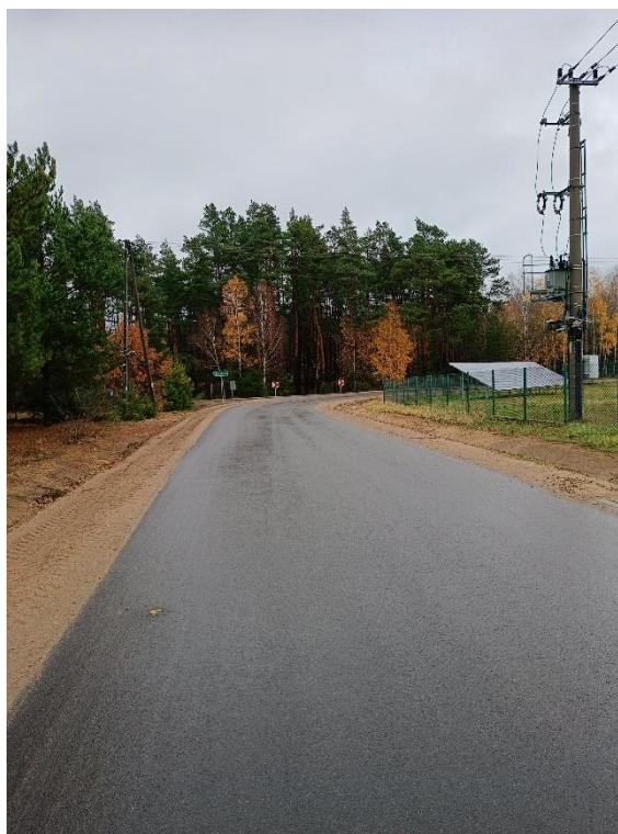
Fot. 6 DP 1883B odc. Leman -Ksebki