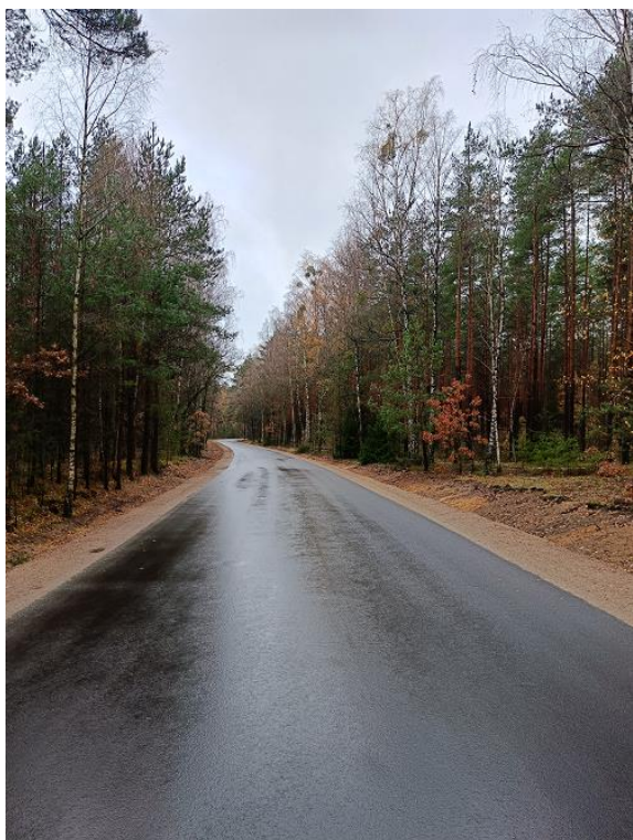
Fot. 5 DP 1883B odc. Leman-Ksebki