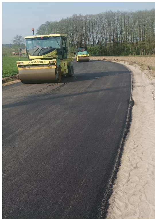
Fot. 2 DP 1879B odc. Górskie