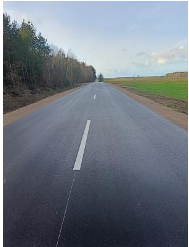
Fot. 12 DP 1830B Stawiski -Jurzec