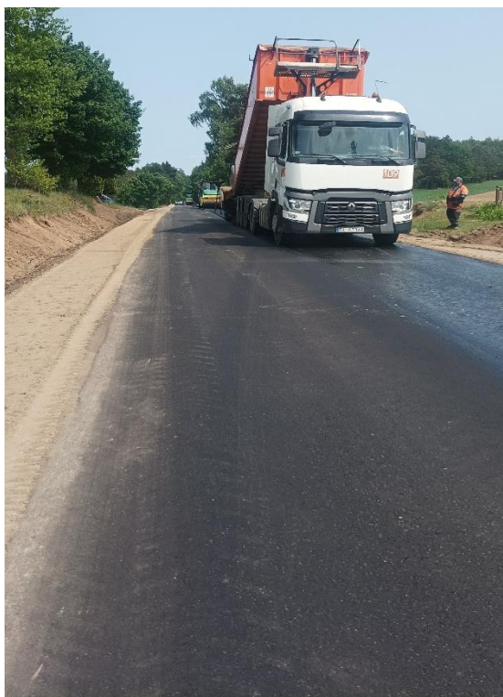
Fot. 1 DP 1869B odc. Milewo Galązki

Wartość zadania: 5.774.117,21 zł, procentowy udział własny wnioskodawcy w realizacji inwestycji: 13,41 %, dofinansowanie: 5 000 000 zł - 86,59 % .