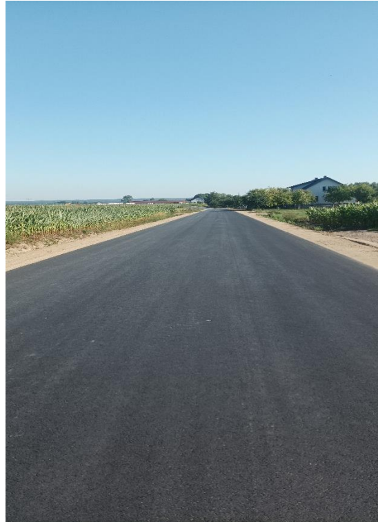
Fot. 8 DP 1882B Żebry-Okurowo-Brzózki