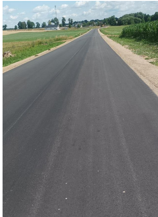
Fot. 4 DP 1869B odc. Stary Gromadzyn