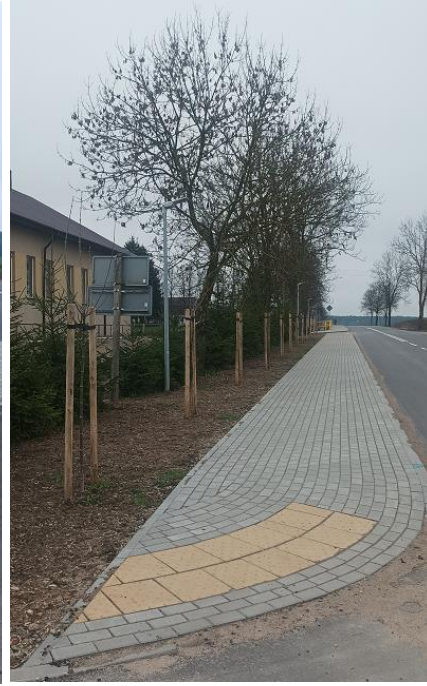
Fot. 10 DP 1830B Stawiski-Jurzec etap I