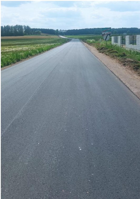
Fot. 3 DP 1869B odc. Lachowo