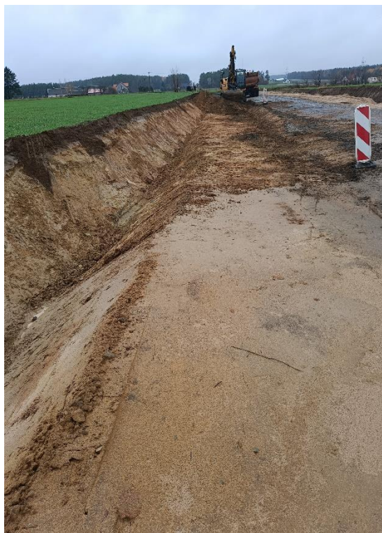
Fot. 13 DP 2640B w trakcie przebudowy