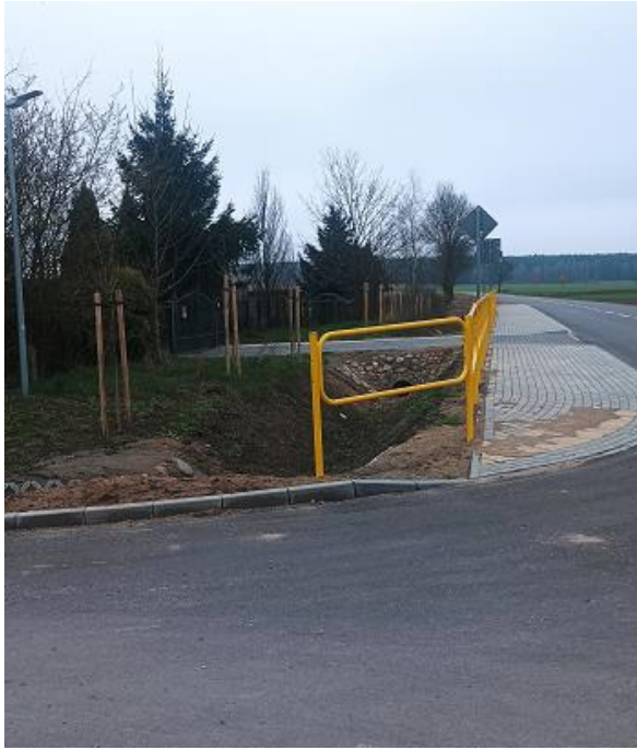
Fot. 9 DP 1830B Stawiski-Jurzec etap I